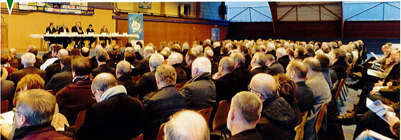
Assemblée Générale 4 février 2017 • Boulay